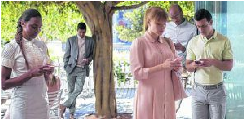
Black Mirror | Nosedive

para responderlas? Este puede ser el título de la disertación: " ¿Está la tecnología suponiendo un progreso en nuestras vidas? ".