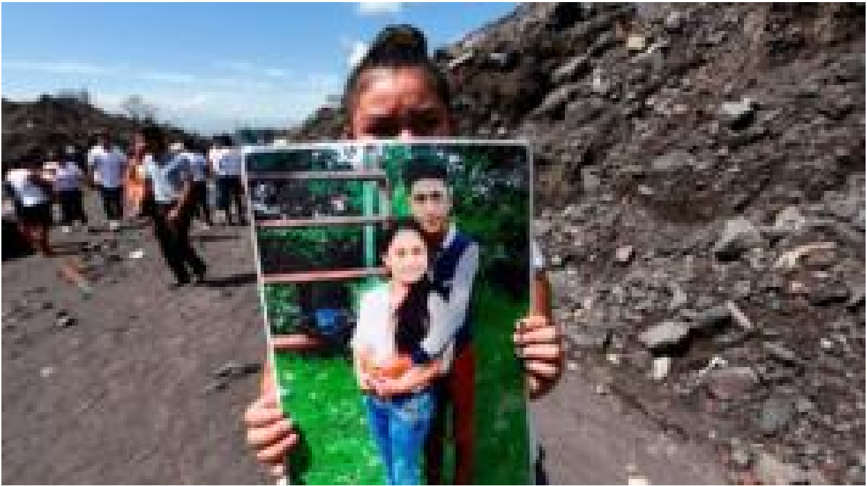
"No es madera, es carne humana": el trabajo de los voluntarios que recuperaron los cuerpos de los muertos en la "Pompeya de Guatemala"

Cómo los humanos se domesticaron a sí mismos antes que a cualquier otro animal