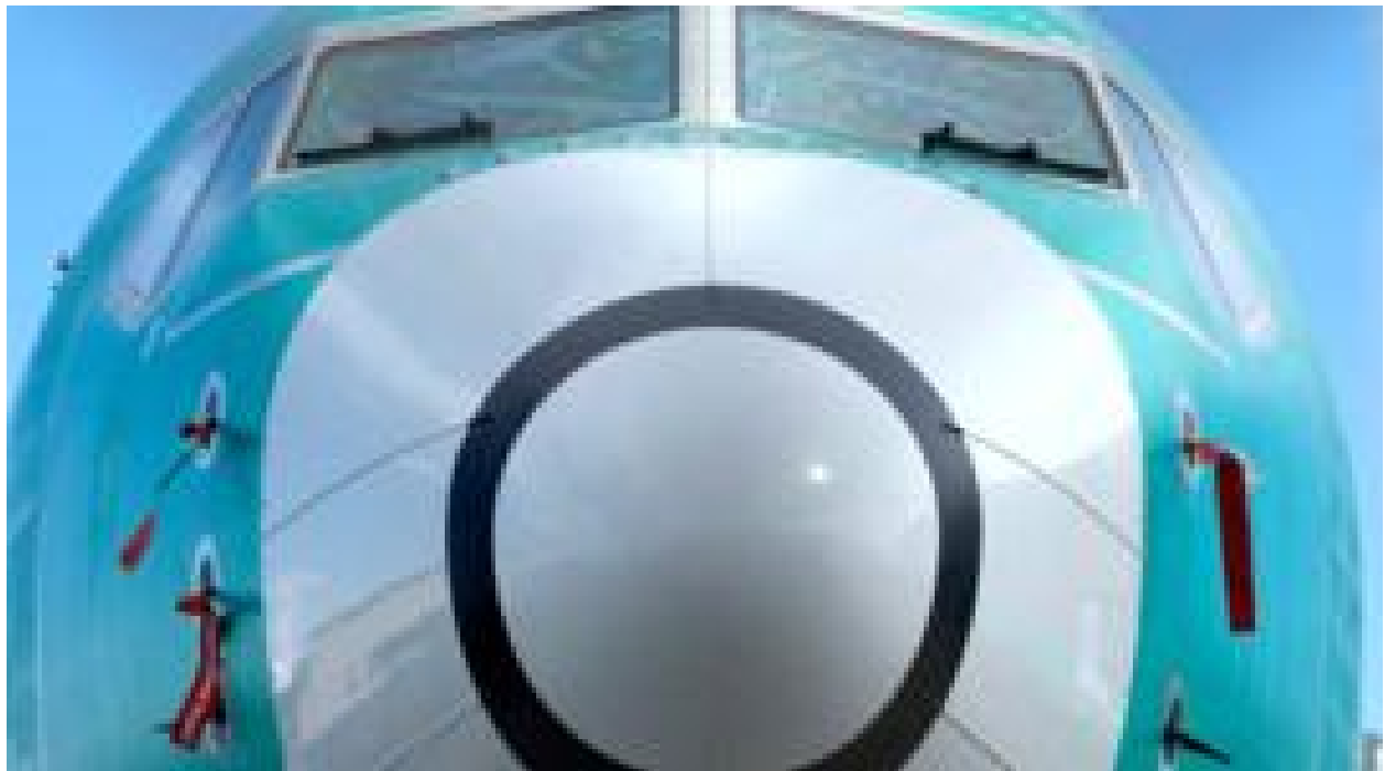
"Crearé un caos para las aerolíneas": la decisión "sin precedentes" de Boeing de detener la producción de su problemático modelo 737 MAX