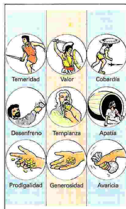
B La virtud ética está en el medio entre dos extremos falsos.

Aristóteles distingue dos tipos de virtudes en el ser humano: morales (éticas) e intelectuales (dianoéticas). Entre las intelectuales cita la prudencia ( phrónesis ), que es la virtud del hombre sensato; y la sabiduría